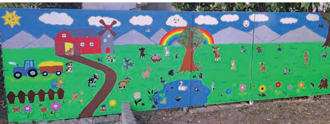
Von Eltern und Personal neu gestaltetes Gartentor des Kindergartens

In unserer Einrichtung werden 67 Kinder von sechs Erzieher*Innen und fünf Kinderpfleger*Innen betreut. Seit September 2023 hat sich unsere Öffnungszeiten von 16.30 Uhr auf 16 Uhr verkürzt.