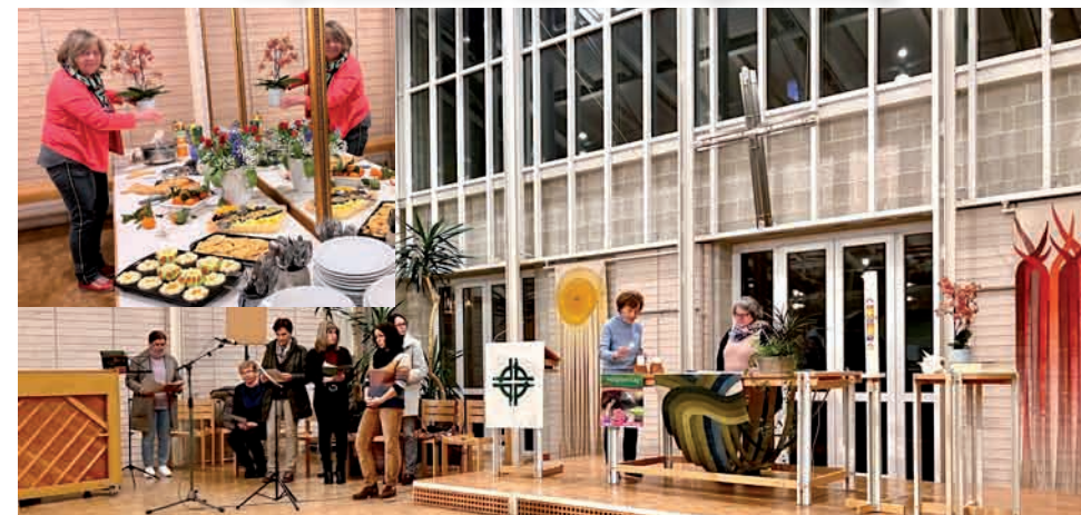
Rückblick auf den Weltgebetstag „Glaube bewegt“ aus Taiwan am 3. März.